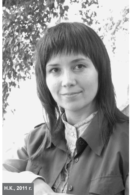
Н.К., 2011 г.

Сейчас у меня такое ощущение, что я живу одновременно несколько жизней в разных мирах. Или