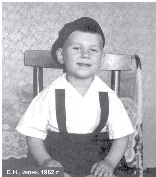
С.Н., июнь 1962 г.