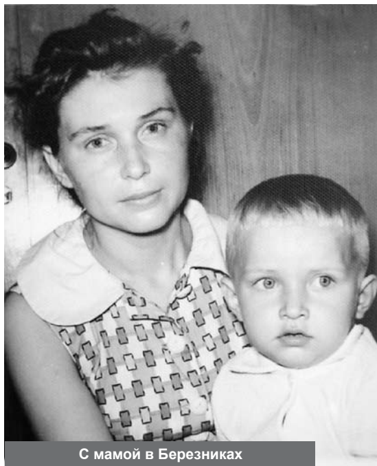
С мамой в Березниках