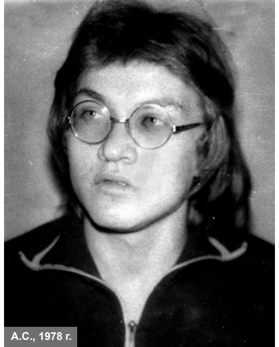
А.С., 1978 г.

Вскоре после «Прерафаэлит» выпустил я ещё одну, очень сильную и красивую книжку. Называется «Подземный дирижабль». Долго-долго она была для меня самой заветной? – да, именно так,