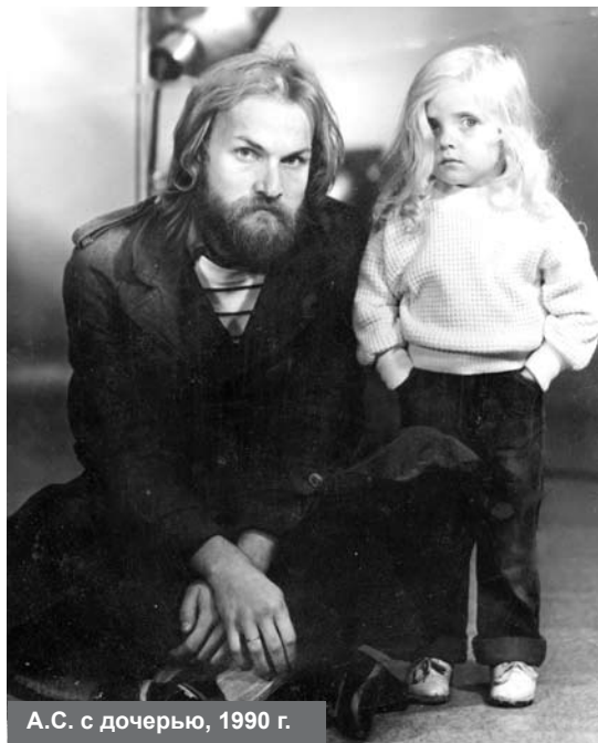
А.С. с дочерью, 1990 г.

Александрийский) сказал: «Радующийся чужому греху – грешит». От этого у меня и тоска была, от злой, разрастающейся радости при известии о новых грехах и подлостях всех этих цыган, ментов, наркоманов, чиновников, политиков. Если мне сообщали, что следователь, ведущий против меня уголовное дело («за клевету», ага), умер в своём кабинете от героиновой передозировки – я просто хохотал от радости. А в перерывах между этими «восторгами» – неподъёмная тоска. И понял я вот что: с каждым узнаванием о чужом грехе